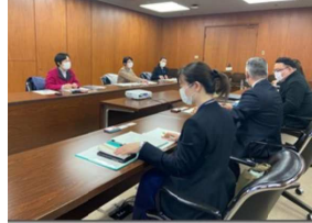
大阪市教育委員会との懇談