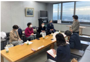
堺市教育委員会との懇談