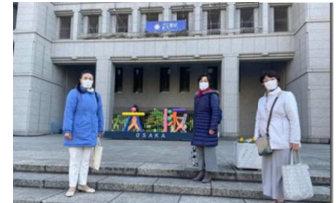
大阪市役所本庁舎前